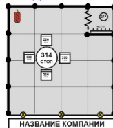
Стенд 12 - 17 кв.м. 1кВт