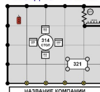
Стенд 18 - 24 кв.м. 2кВт