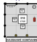
Стенд 6 - 11 кв.м. 1кВт